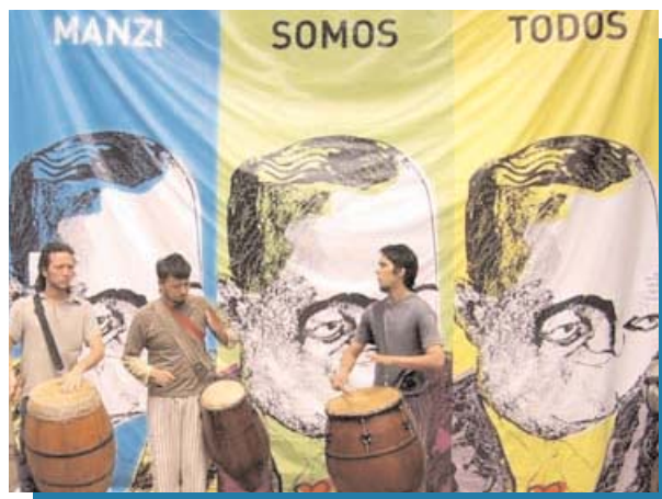
Maderas del Río de la Plata

boedo@redculturaboedo.com.ar www.redculturaboedo.com.ar