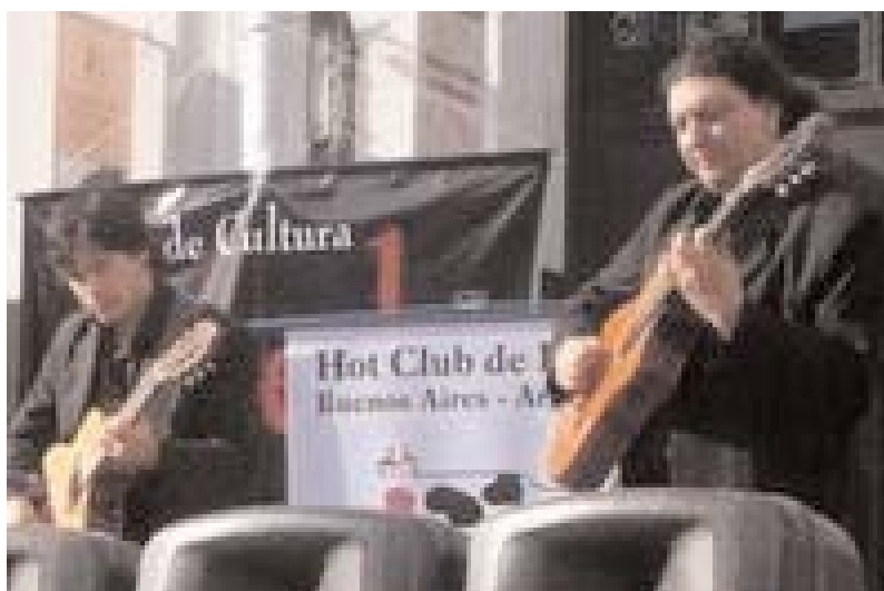
Hot Club de Boedo

boedo@redculturaboedo.com.ar www.redculturaboedo.com.ar