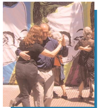
Público en la Cortada San Ignacio